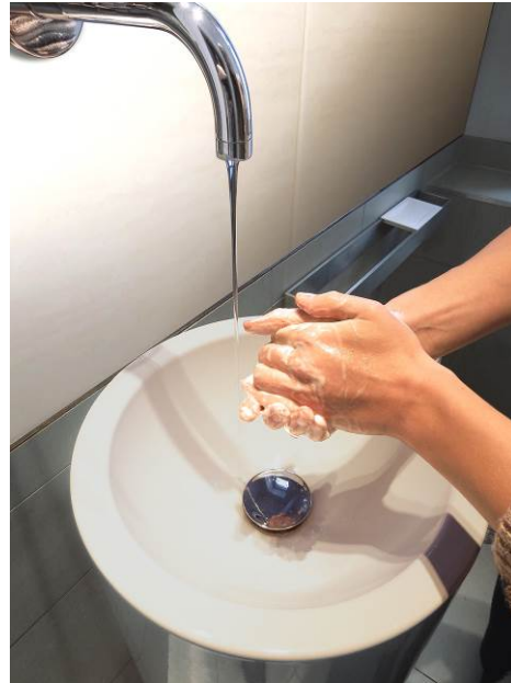
Abbildung 1: Hände waschen.

Tatsächlich: Nur mit Wasser und ohne Seife wird man den öligen Film auf der Haut nicht los, die Hände werden nicht sauber. Doch warum geht das mit Seife sofort?