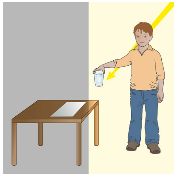
Abbildung 2: So baust du das Experiment auf.

Tipp: Du kannst das Papier beispielsweise an folgenden Stellen ablegen, wenn sich diese an der Schattengrenze befinden: Auf einer Fensterbank, einem Tisch oder einem Stuhl oder unter einem Baum. Oder du arbeitest mit einem Partner, der das Papier an die richtige Stelle hält.