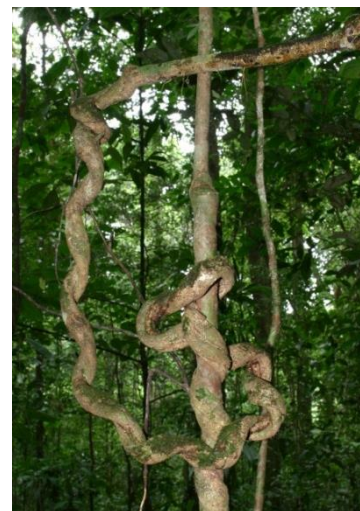
Lianen im Regenwald.