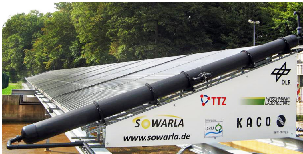
Abb. 2: Im DLR-Standort Lampoldshausen reinigt diese Anlage unter Einsatz von Sonnenlicht Abwasser von schwer abbaubaren Stoffen.

Seit Millionen von Jahren nutzen Pflanzen die Energie der Sonne für chemische Prozesse. Die meiste Biomasse der Erde beruht so auf der Photosynthese. Auch der Mensch setzt schon seit dem Altertum – z.B. bei Bleichverfahren – die Sonnenenergie für chemische Prozesse ein. In der Industrie spielte Photochemie trotz der kostenlosen und unerschöpflichen Verfügbarkeit der Energiequelle in den letzten 100 Jahren aber nur eine geringe Rolle. Dies wird sich jedoch wahrscheinlich bald ändern.