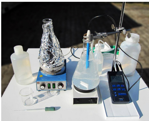
Abb. 3: Experimentaufbau

Beide Erlenmeyerkolben werden auf elektrische Rührgeräte ins Sonnenlicht gestellt und ständig gerührt. Falls ihr nur einen Rührer habt, könnt ihr Experiment und Vergleichsexperiment nacheinander durchführen. Dabei müsst ihr aber die Sonneneinstrahlung beobachten, die vergleichbar sein sollte.