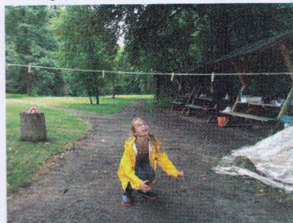
Insekten werden gejagt

spielerische Wissensvermittlung zu der Sinneswahrnehmung, dem Lebensraum, der Ernährung und der Physiologie von Vögeln sowie zu Bionik und Vogelschutz. Unterschiedliche Lehrinhalte der Grundschul-Curricula aus dem Sachunterricht wurden integriert und die individuelle Kreativität mit Naturmaterialien gefördert. Verpackt ist dieses spannende Wissen in gut 250 mögliche Aktionseinheiten, welche didaktisch aufeinander abgestimmt, vorbereitet wurden. Bildungseinheiten zur Historie der Vogelschutzwarte, zur Vogel- und Kinderwelt, was essen Vögel, wovor haben Vögel Angst