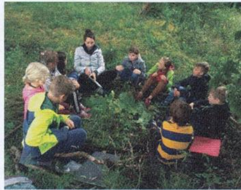
Gemütlichkeit im selbst gebauten Nest

Die Teamenden haben an einigen Stellen sehr konstruktive Verbesserungsvorschläge gemacht. Die bereitgestellten Materialien ließen eine wertvolle Bildungsarbeit zum Vogelverständnis von Grundschulkindern zu. Die Kinder waren wissbegierig, phantasievoll und nahmen die Bildungsaktionen gerne an. Ein „Best off“ ergibt sich durch den ganz besonderen außerschulischen Lernort, der historischen, aus dem 12 Jahrhundert stammende Wasserburg, der heutigen Vogelschutzwarte Seebach. Durch die Kooperation mit dem Verein der Freunde der Vogelschutzwarte Seebach e.V. und die Integration der Historie in das Programm erhielten die Schüler*innen ein