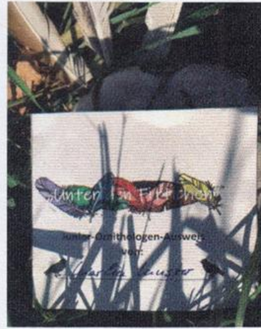
Spielerisch „erarbeitet“: der Junior-Ornithologen-Ausweis

ler*innen ergab ein durchweg positives Bild.