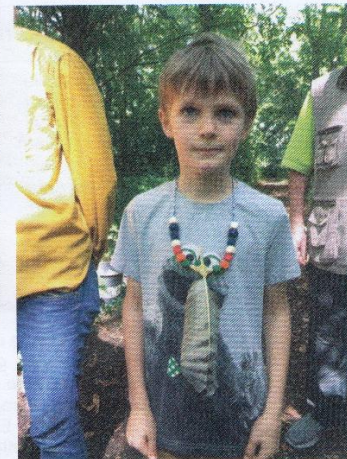
Schmuckfeder – selbst gebastelt

spielerische Wissensvermittlung zu der Sinneswahrnehmung, dem Lebensraum, der Ernährung und der Physiologie von Vögeln sowie zu Bionik und Vogelschutz. Unterschiedliche Lehrinhalte der Grundschul-Curricula aus dem Sachunterricht wurden integriert und die individuelle Kreativität mit Naturmaterialien gefördert. Verpackt ist dieses spannende Wissen in gut 250 mögliche Aktionseinheiten, welche didaktisch aufeinander abgestimmt, vorbereitet wurden. Bildungseinheiten zur Historie der Vogelschutzwarte, zur Vogel- und Kinderwelt, was essen Vögel, wovor haben Vögel Angst