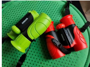
Ferngläser der Vogelschutzwarte