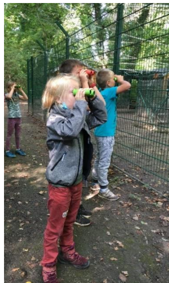
Kleine Forscher beobachten Störche an der Vogelschutzwarte