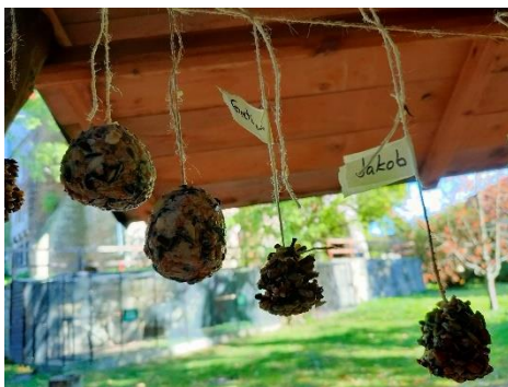
Futterwerkstatt und der Bau eines Futterhauses