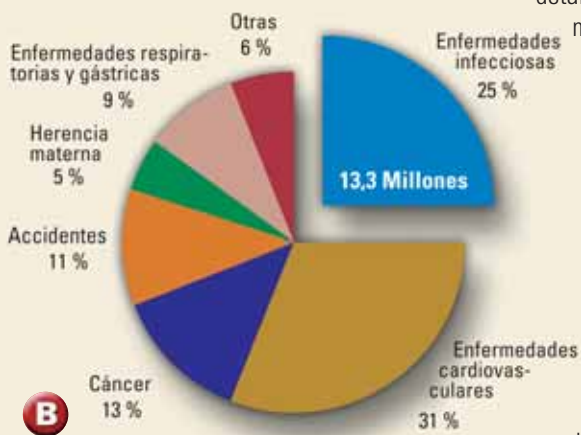
▲ Causas de los 53,9 millones de decesos en todo el mundo (Fuente: OMS, 1999).

LYMERix es el más reciente y probablemente también el último ejemplo de una vacuna de acción convencional. Como tal, estimula ante todo, los linfocitos B que producen los anticuerpos. Pero los linfocitos B