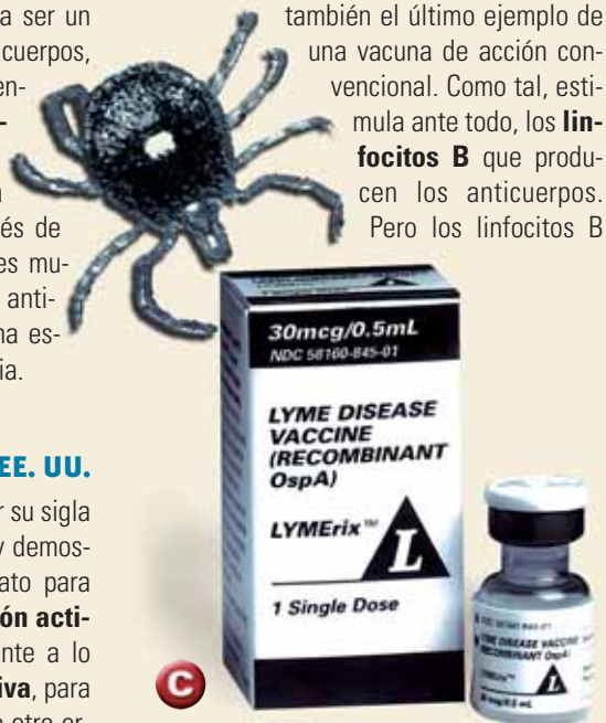
▲ La enfermedad de Lyme fue llamada así por la localidad que lleva el mismo nombre en el estado de Connecticut, EE.UU., donde se detectó la enfermedad. Por eso, la primera vacuna contra la borreliosis fue llamada LYMERix.

A principios de la década de 1980 científicos del Instituto Max Planck de Inmunobiología